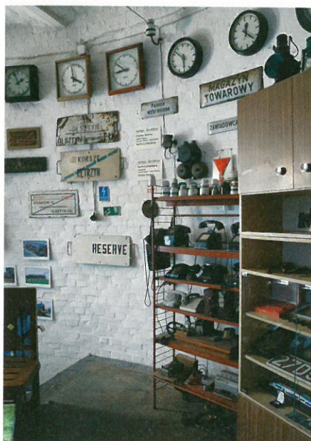
Wnętrze Muzeum Kolejnictwa

Olsztyn, mimo że często jest przez turystów pomijany, ma bardzo wiele do zaoferowania osobom odwiedzającym miasto. Dlatego podróżując po północy Polski warto zaplanować sobie wizytę w mieście, w którym historia widoczna jest niemal na każdym kroku.